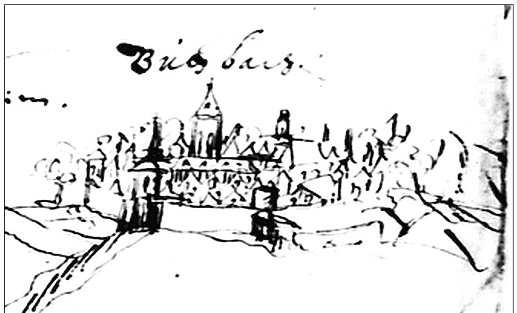
Ausschnitt aus der Geleitstraße von 1679 mit der Skizze von Butzbach.