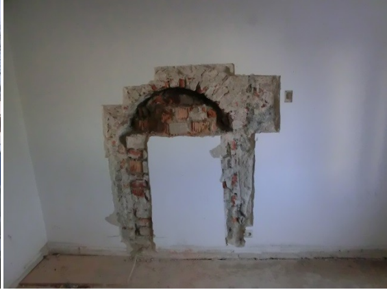
Freigelegte Fensteröffnung 2. OG