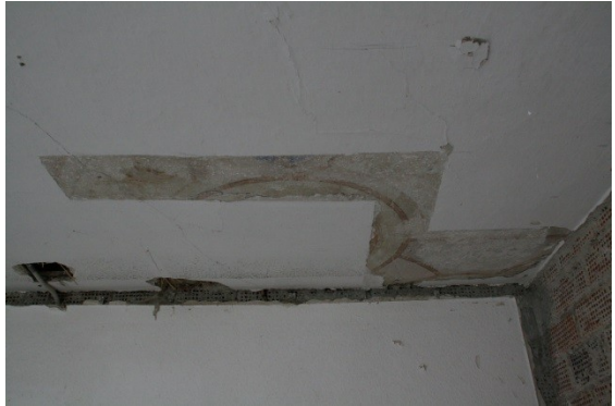
Freigelegte Deckenbefunde, 2. OG