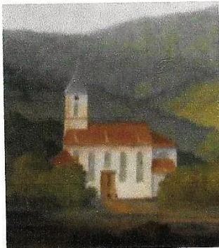
Kath. Pfarrkirche St. Bartholomäus Ortenberg/Baden