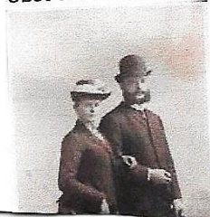
Trauzeuge des Bräutigams obst von Beckedorff

Quelle: Buch: Schloss Ortenberg/Baden 1838-1988 Autor: Prof. Dr. Franz Xaver Vollmer Repro: Hermann Bürkle, Ortenberg, 02.11.2014