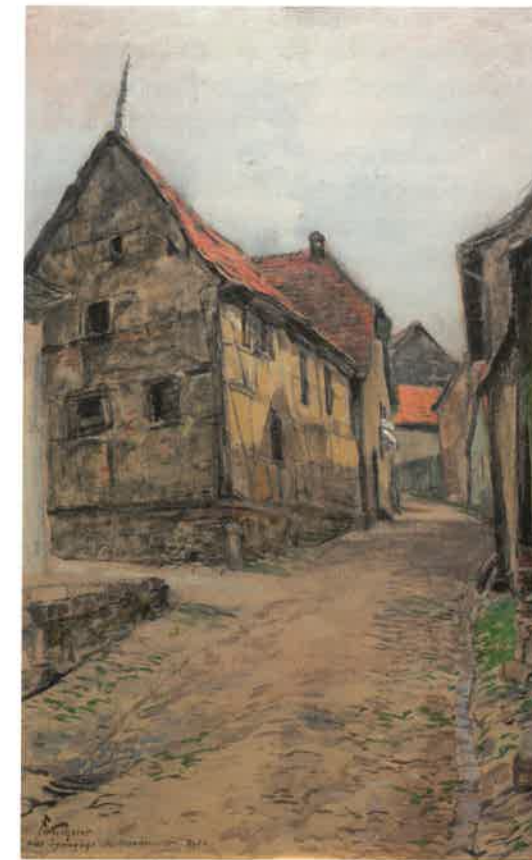
Die Synagoge in der Mauerstraße, von Fritz Wucherer 1926

den. In Anbetracht der Armut vieler Juden im hessischen Raum war Nassau wenig am Zuzug fremder Juden gelegen. Daher erhob es bei der Aufnahme ins Schutzverhältnis 1.500 Gulden pro Mann und 1.000 Gulden je Frau bei zugezogenen Juden, während Einheimische 500 bzw. 300 Gulden zu entrichten hatten. 1815 trat eine eigene Judensteuer an die Stelle des Schutzgeldes und wurde als Einkommensteuer bis 1841 erhoben. Anschließend unterlagen die nassauischen Juden wie alle Landeseinwohner der Gewerbesteuer 36 . Bei der Neuordnung der Gemeindeverhältnisse 1816 blieben die Juden von der Gemeindebürgerschaft ausgeschlossen. Zu diesem Zeitpunkt lebten in Kronberg 25 jüdische Familien, in Falkenstein und Oberursel je acht, in Königstein vier und in Neuenhain zwei, 1820 in Kronberg 29 jüdische Steuerzahler, 1828/28 nur noch 21 und 1839/40 mit 34 wieder deutlich mehr 37 .