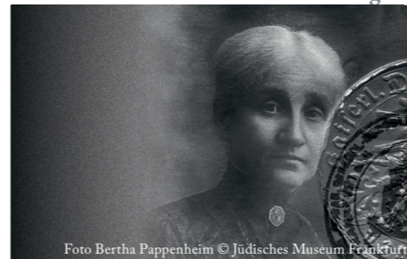
Eintritt: 5,- € Veranstalter: Freunde Jüdischer Kultur e.V., www.freunde-juedischer-kultur-esslingen.de