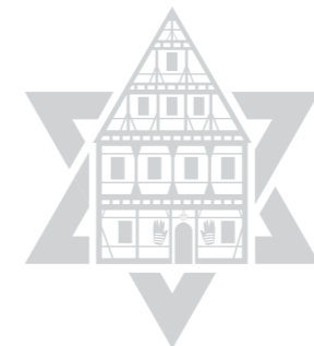
200 Jahre Esslinger Synagoge