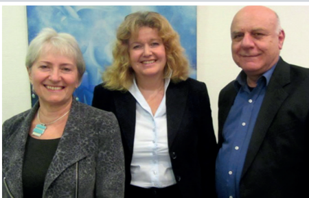
Sehr geehrte Damen und Herren, Bürgerinnen und Bürger Esslingens, liebe Gemeindemitglieder,

jüdisches Leben ist zurückgekehrt, nach langem Winter erblüht es neu. Nicht mehr nur in Stuttgart, sondern auch an vielen anderen Orten Württembergs haben jüdische Menschen – zumeist Zuwanderer aus der ehemaligen Sowjetunion – ein neues Zuhause gefunden. Sie engagieren sich auf vielfältige Weise in der Gemeinde und zunehmend auch in der Bürgerschaft.