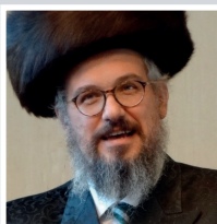
Sehr geehrte Damen und Herren, liebe Festgemeinde,