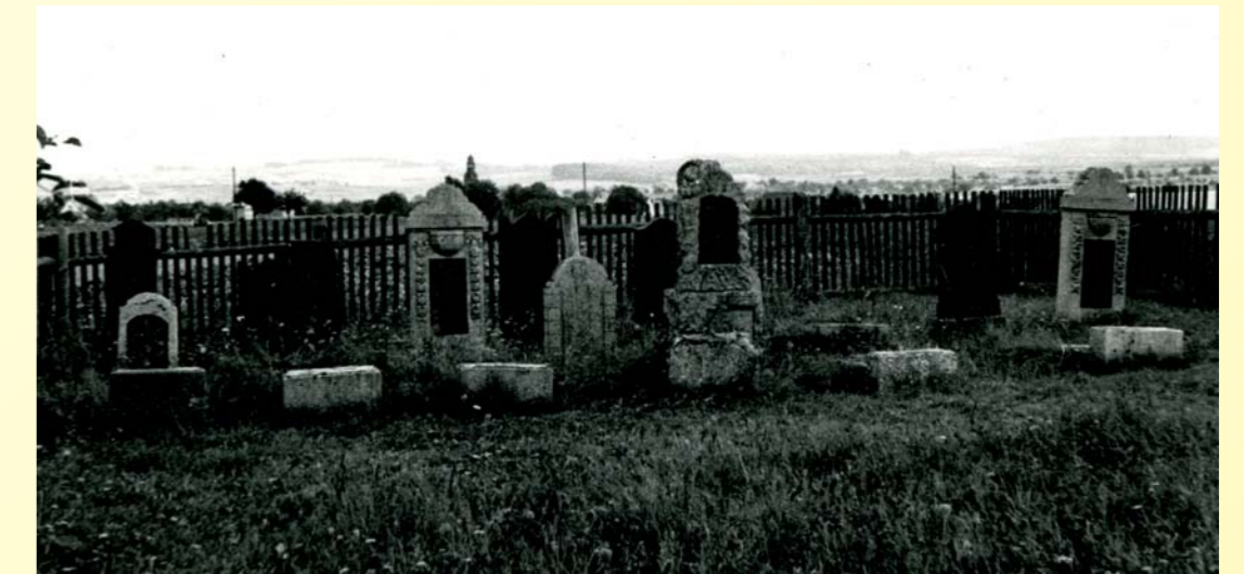
Abbildung 5: Jüdischer Friedhof Hörnshelm nach dem 2. Weltkrieg