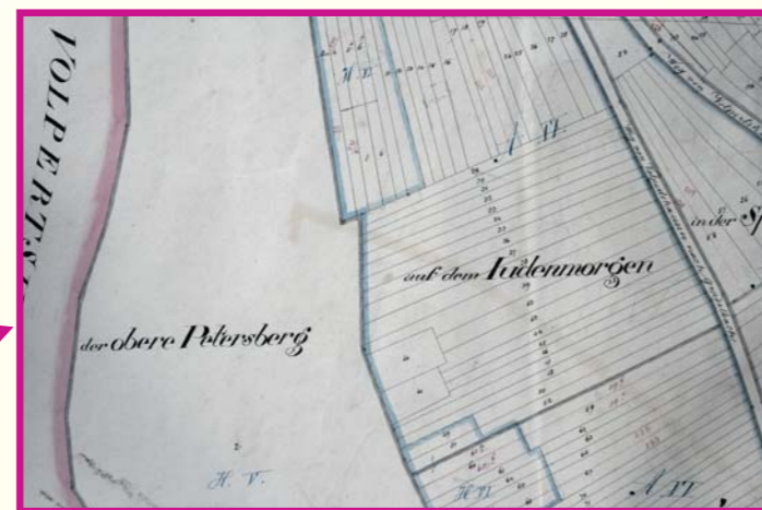
Abbildung 2: Flurbezeichnung „Auf dem Judenmorgen“, Flurkarte von 1862 ● = Standort ● = Lage Flurstück Judenmorgen