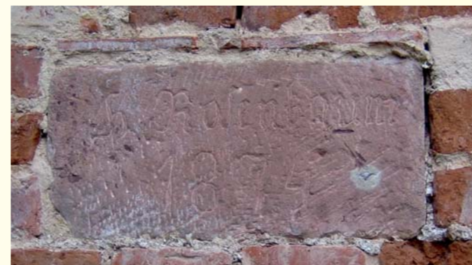
Abbildung 4: Namenszug an einer Scheunenwand in Langgöns, wo Heimann Rosenbaum einmal wohnte. Er wurde als letzter auf dem Friedhof in Vollnkirchen beerdigt.

1894 fand die erste Beerdigung auf dem neuen Friedhof in Hörnshelm ( Abb. 5 ) statt. Es war die des nur neunjährigen Hermann Rosenbaum aus Hörnshelm ( Abb. 6 ).