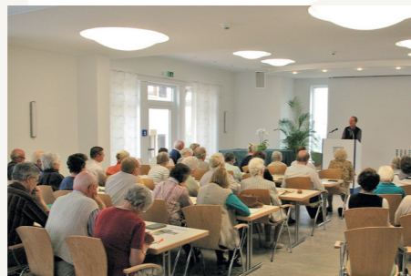
Seminare, Bibelwochen, Freizeiten