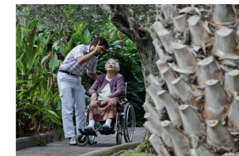
Liebevolle Zuwendung über die Pflege hinaus

„Tröstet, tröstet mein Volk!“ spricht euer Gott. Jesaja 40,1