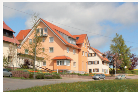
Gästehaus Bethel in idyllischer Lage

Auf Wunsch erhalten Sie gerne unseren separaten Hausprospekt und das aktuelle Jahresprogramm.