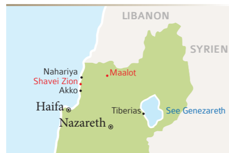
ZEDAKAH-Standorte (rot) in Israels Norden