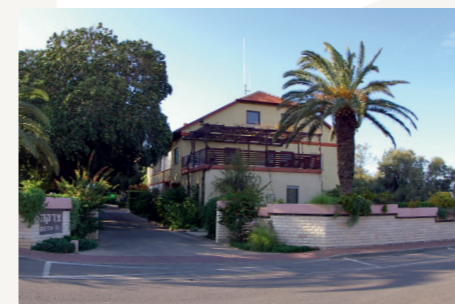
Beth El – Gästehaus in Shavei Zion

In unserem Pflegeheim in Maalot werden seit 1984 pflegebedürftige Juden, die den Nationalsozialismus überlebt haben, gepflegt und umsorgt. Dazu stehen 24 begehrte Pflegeplätze zur Verfügung. Das Wort „Elieser“ bedeutet „mein Gott ist Hilfe“. Diese Hilfe sollen die Bewohner durch praktische Nächstenliebe persönlich erfahren.