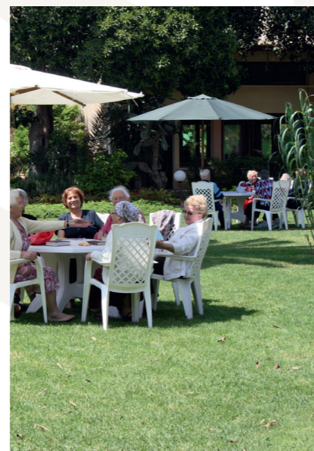
Begegnung unter Holocaustüberlebenden

In unserem Gästehaus bekommen Überlebende des Holocaust seit 1969 die Möglichkeit, einen kostenlosen Urlaub am Mittelmeer zu verbringen. Dazu werden sie in Gruppen von jeweils 42 Personen für zehn Tage eingeladen. Jährlich sind das rund 500 Gäste.